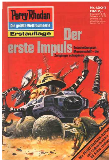
H.G. Ewers (septembre 1984)